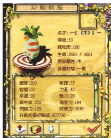
●派艾波能力值(呢隻好勁)

木波真的要好好培養，除了10級前要留意牠有否隨機偏向了其他能力外，千萬不要親和30就武化，一定要堅持錯化，不然8萬多元會白白浪費...獸化出來的話要注意金系及火系的魔法，物理攻擊反而不必太擔心，因為寵物體質高防禦也會很高，所以就算沒有物理免疫也不怕被打得很痛，在血多皮厚的雙重效果之下一定是非常的耐打，所以除了錯化外獸化擋怪也是一個很好的用法，不過還是待牠20級以上才好獸化，而且不宜長時間，不然會影響成長情況。