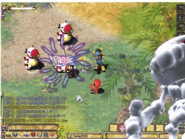
●風動閃（是我弱，不是戰技弱）

戰鬥技能方面有劍技、連擊、衝擊和盾技。有耐心的話最好在10級前好好利用城鎮地下室，先練劍技，飛翔閃能使攻力加乘2，風動閃乘3。然後連擊，最後才是衝擊，但因為衝擊的作用同樣是加攻擊力，比劍技來得弱，而且劣於衝擊後下一回合的閃避率會降低，所以衝擊技甚至可以忽略不理。而盾技最簡單不過，只要身上有個盾牌，戰鬥時看見「Block」即是已經自動產生了效果。到盾技15級可對隊友使出「護保」，再後來的「還擊」在擋格之餘會使敵人受到反彈傷害，也是會隨機自動使用。一般的戰士會用火武化、木鎧化，其實是個不錯的配合。上題提及，要注意金系的怪，遇著牠們不用怕，金剋木同時也被火剋，哪裡有火？正是閣下手中的劍，只要盡快用閃閃技能將牠們逐隻一招了就完全不是問題。遇火也就盡快打死就好，別放得太久免得捱「剋」。想在防武屬性方面配合得好不難，只要「武剋防」就對。即是例如防是屬土，武就要金。（金剋木木剋土）