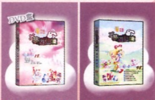
●愛麗絲新手包 ●愛麗絲夢想實現包

香港童話已在上週推出愛麗絲新手包 (港幣18元)，令外在大家在官方上看到的愛麗絲夢想實現包，據官方人員透露，需要延至聖誕前才有貨，不過內附的虛擬物品還不錯的，比起人魚傳說實包所送的較特別，但不知道何時會有台灣版那麼多新道具呢？