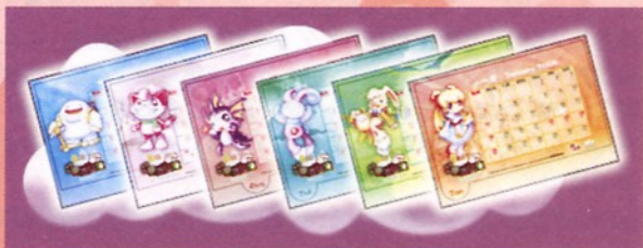
●愛麗絲2004年座禮月曆